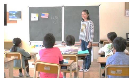
すこやか委員長さんが、5月8日の戦勝記念日の説明をしました。