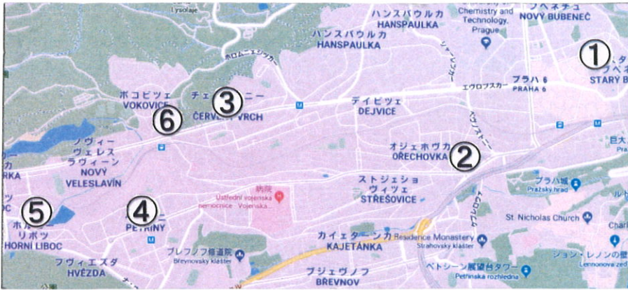
① Bubenec (Puškinovo nám.の広場)